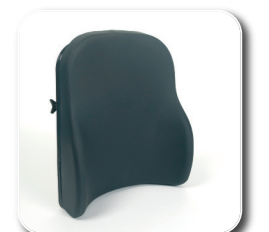
voorgevormde rug L34