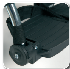
voetplaten regelbaar in hoek