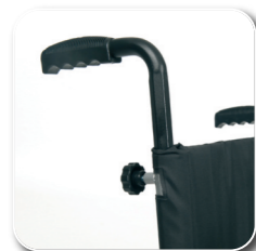
in hoogte instelbare duwhandvatten