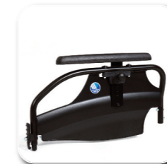
regelbare armsteun B04