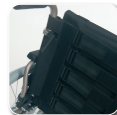
naspanbare rug en zit