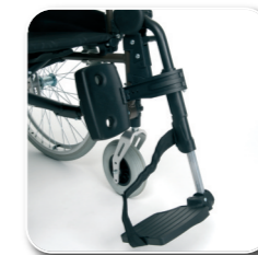
BZ8 lengte corrigerende beensteun