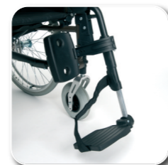
optie BZ8 lengte corrigerende beensteun